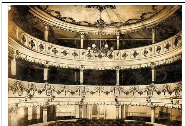
Teatrul din Oravița – 1817 (primul teatru din România; aici, în 1868, trupa lui Mihail Pascaly, din care făcea parte și Mihai Eminescu, în calitate de sufleur, a avut două reprezentații)

NENEA COSTICĂ: Bine, foarte bine! Multă sudoare, mult succes; puțină sudoare, puțin succes, și ioc sudoare, ioc succes. Dar nu-i oboseala de vină. Tu, fetițo, n-ai încredere în vorba mea.