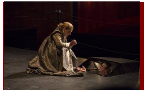
Soprana Radvanovsky vorbind cu Vlad Iftinca în timpul unei pauze la Metropolitan Opera, New York ( www.nytimes.com )